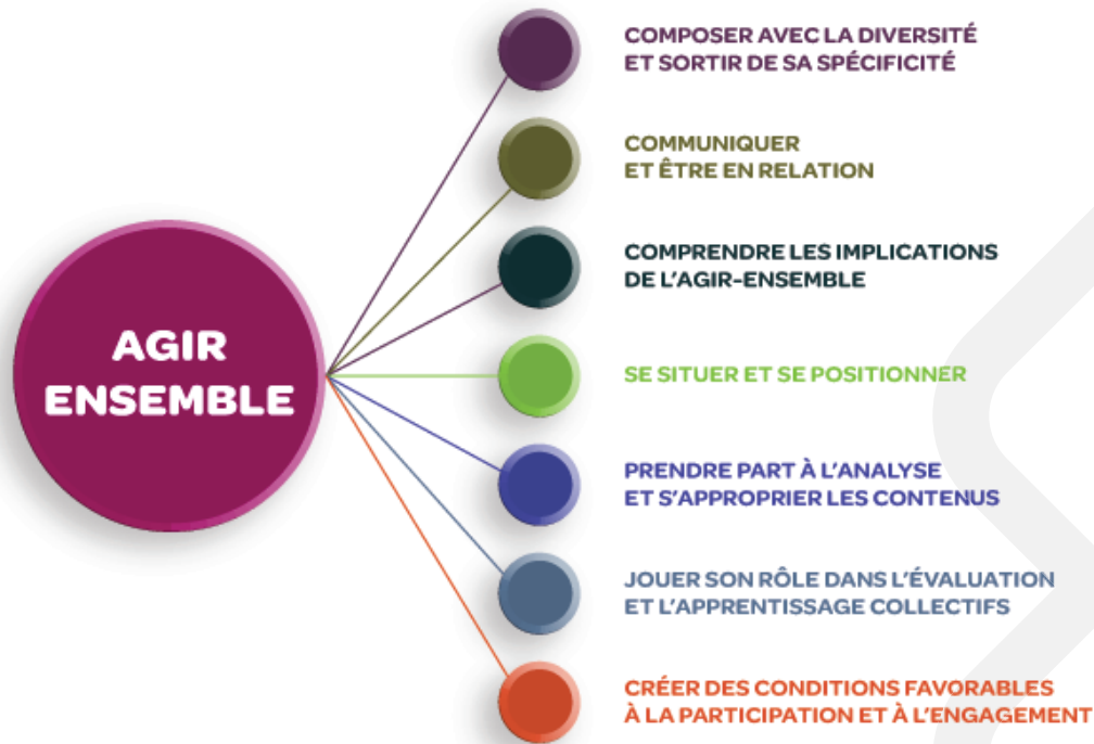
Figure 3 – Aide mémoire sur les compétences essentielles à l'agir-ensemble

Le chantier sur le développement des compétences a décidé de porter son regard sur les compétences essentielles à l'agir-ensemble au sein d'un système d'action concertée (SAC). Cinq fonctions occupées par les acteurs des SAC ont été mises en lumière afin d'arriver à préciser les compétences essentielles à chacune. Il est ressorti que les compétences de participation auraient avantage à être maîtrisées par l'ensemble des individus prenant part aux activités d'un SAC, quelle que soit leur fonction.