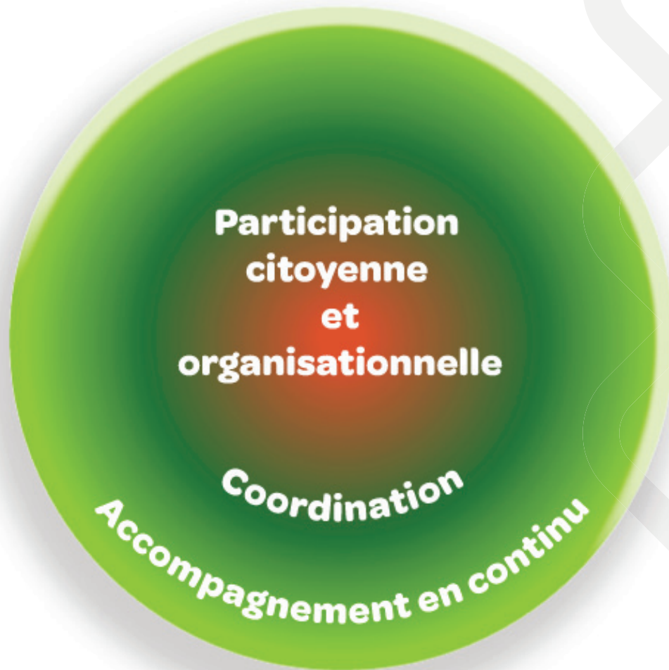
Figure 2 - Illustration des fonctions dans un système d'action concertée

ctions retenues figurent dans la figure ci-dessous. On doit ici comprendre que le cœur d'un SAC est constitué de la fonction de participation (citoyenne ou organisationnelle), à laquelle s'ajoute celle de coordination et finalement d'accompagnement (en continu ou ponctuel). La figure montre que les frontières sont fluides entre les fonctions, ce qui tient compte qu'un même acteur peut parfois naviguer entre deux fonctions. La figure témoigne également de cette capacité collective recherchée qui est celle de coconstruire, de mailler les expertises et d'agir en intersectorialité.